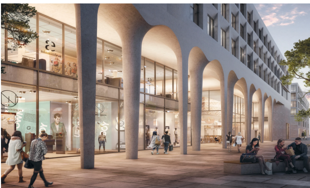
Visualisierung: moka-studio / Architekt: Störmer Murpy and Partners