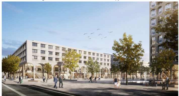
Visualisierung: moka-studio / Architekt: Störmer Murpy and Partners