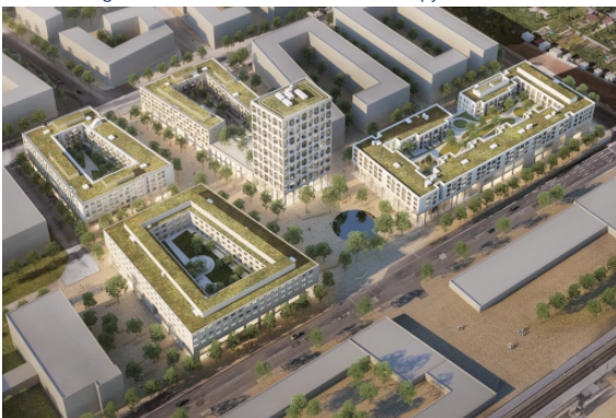
Visualisierung: moka-studio / Architekt: Störmer Murpy and Partners